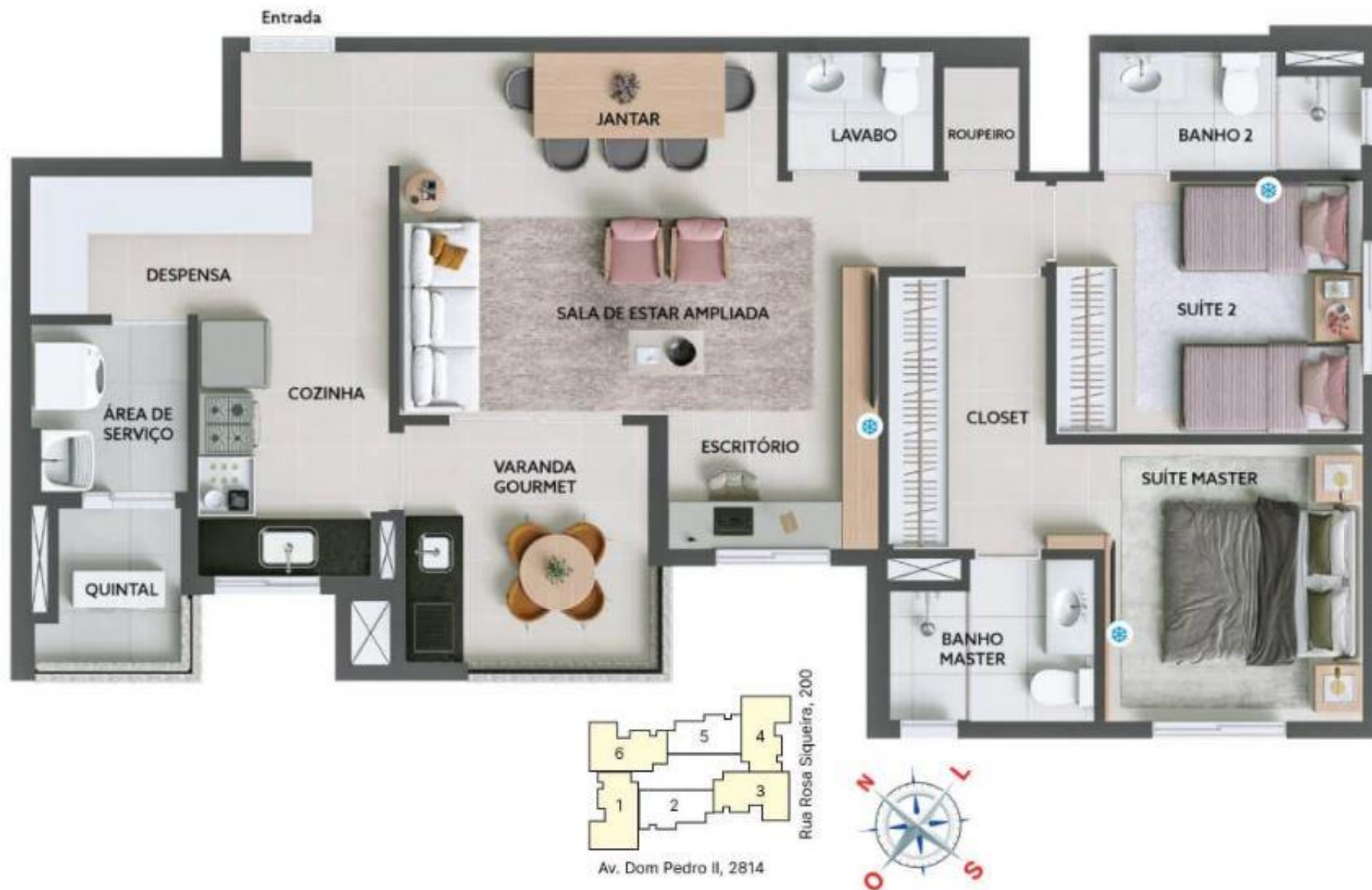
Planta de 93 m 2 - sala ampliada