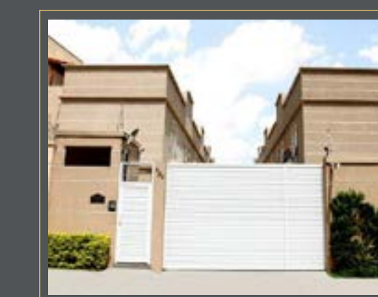
RES. CAMARGO SOARES

R. DOS JEQUITIBÁS, 823 CAMPESTRE, SANTO ANDRÉ