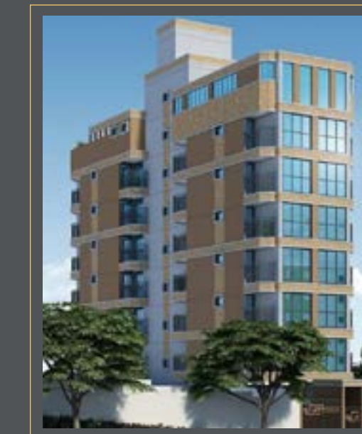
RES. PRIVILEGE SKY

R. ATIBAIA, 523 VILA VALPARAISO SANTO ANDRÉ