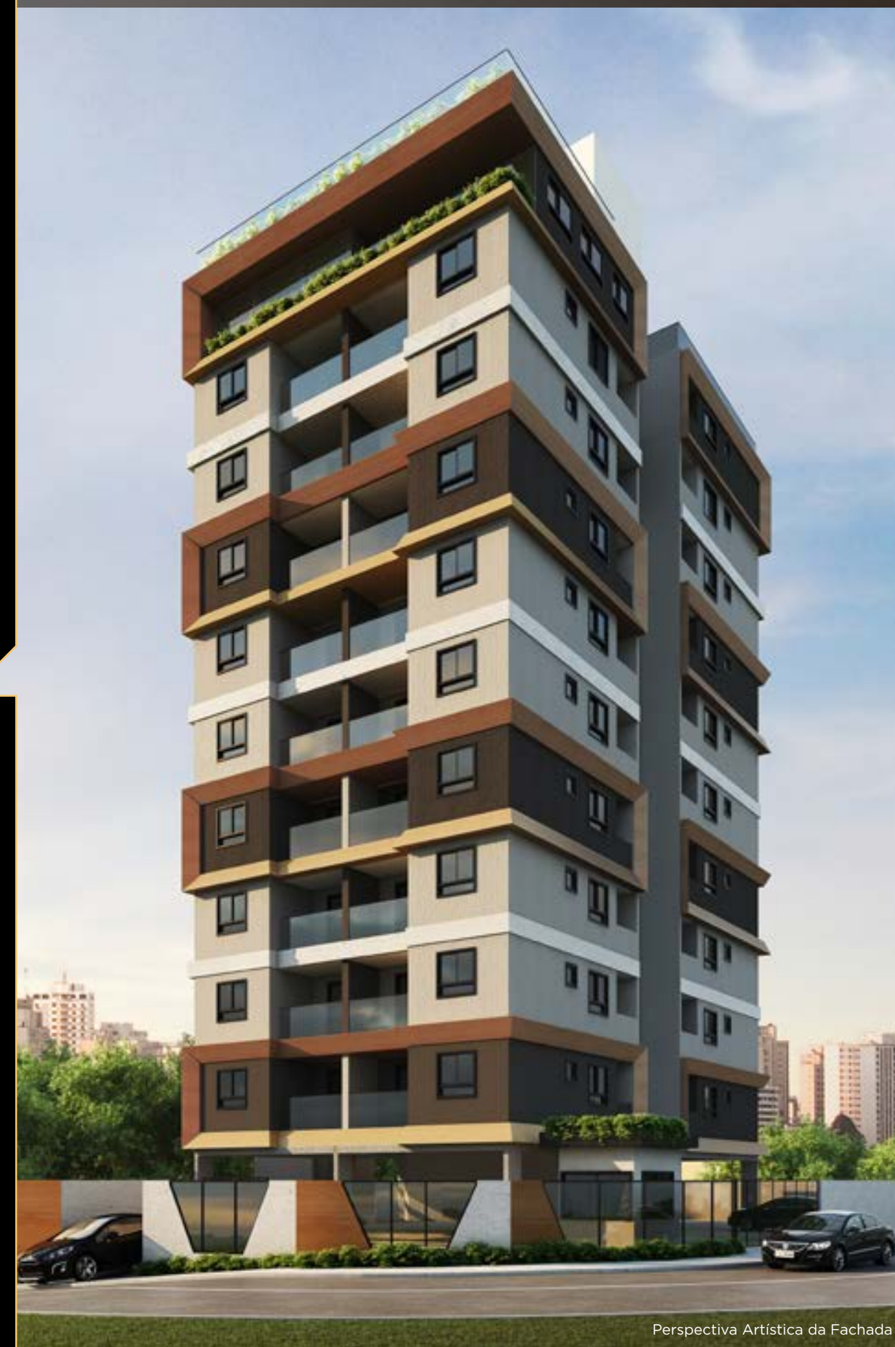
Perspectiva Art stica da Fachada

Pq. da Juventude Citt  Di Mar stica.....0min. Centro de S o Bernardo .....0min. S o Bernardo Plaza Shopping.....0min. Av. Pereira Barreto .....0min. Shopping ABC .....0min. Distancias percorridas de carro.