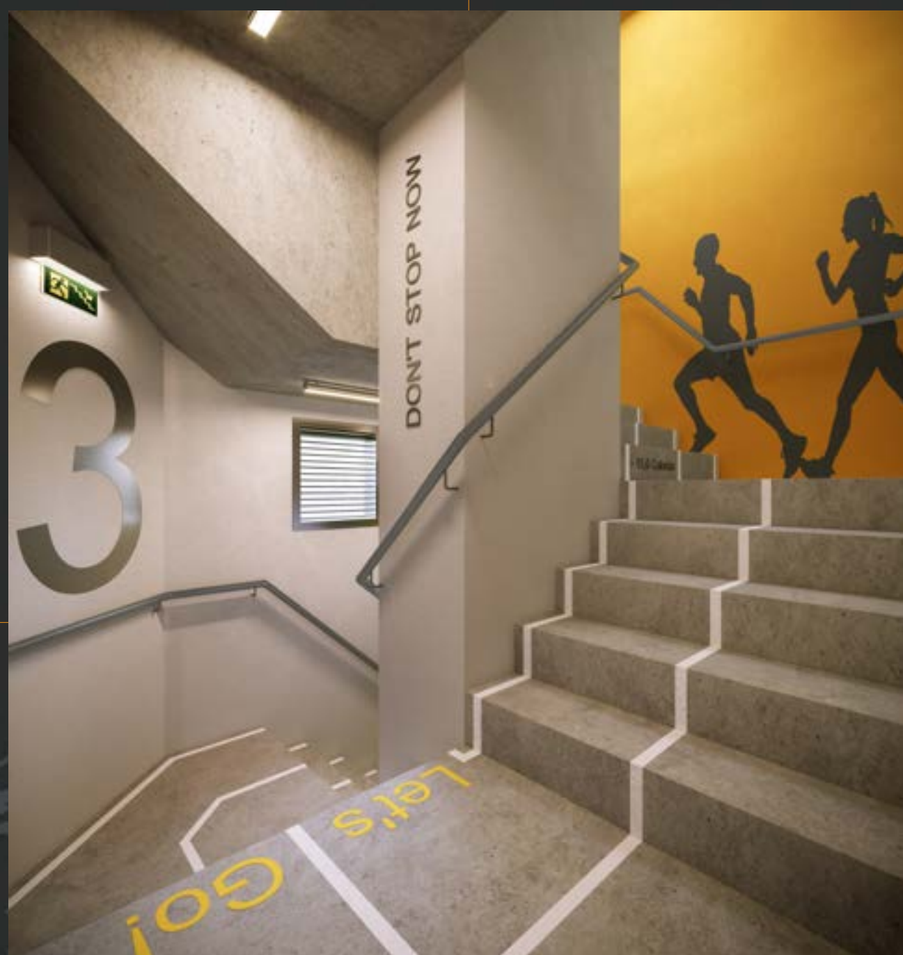
Perspectiva Artística da Escada