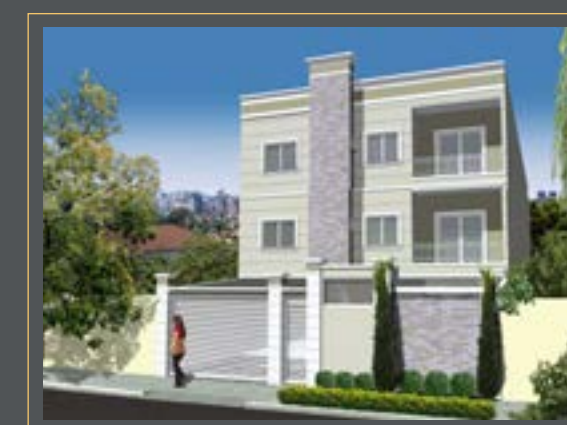
RES. CAMPESTRE GARDEN II

R. DAS LARANJEIRAS, 2805 CAMPESTRE SANTO ANDRÉ