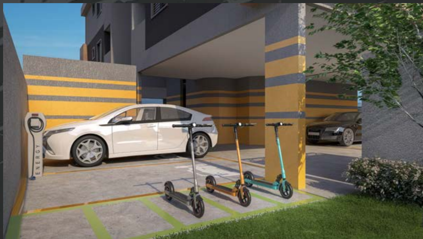
Perspectiva Artística da Garagem