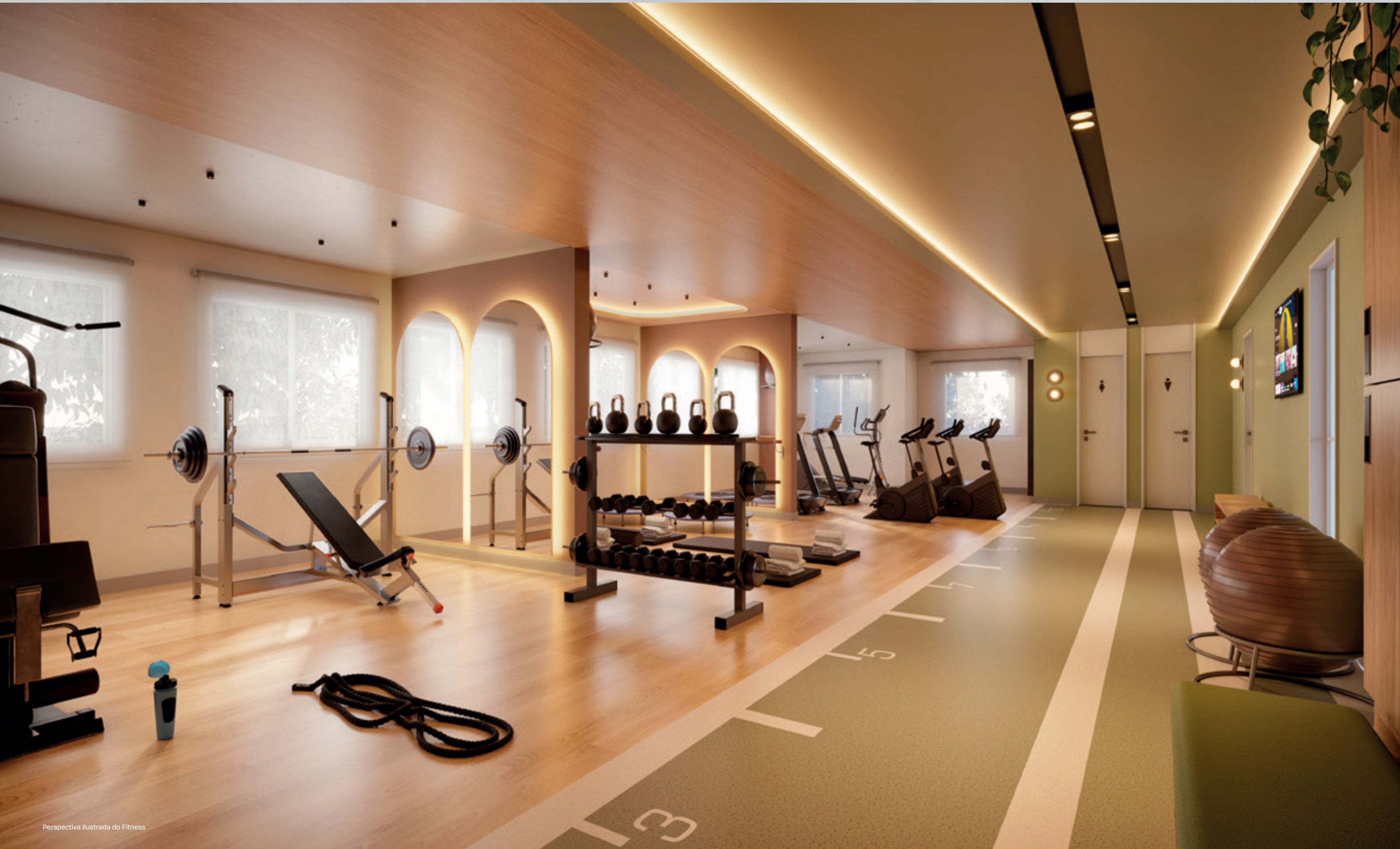
Perspectiva Ilustrada do Fitness