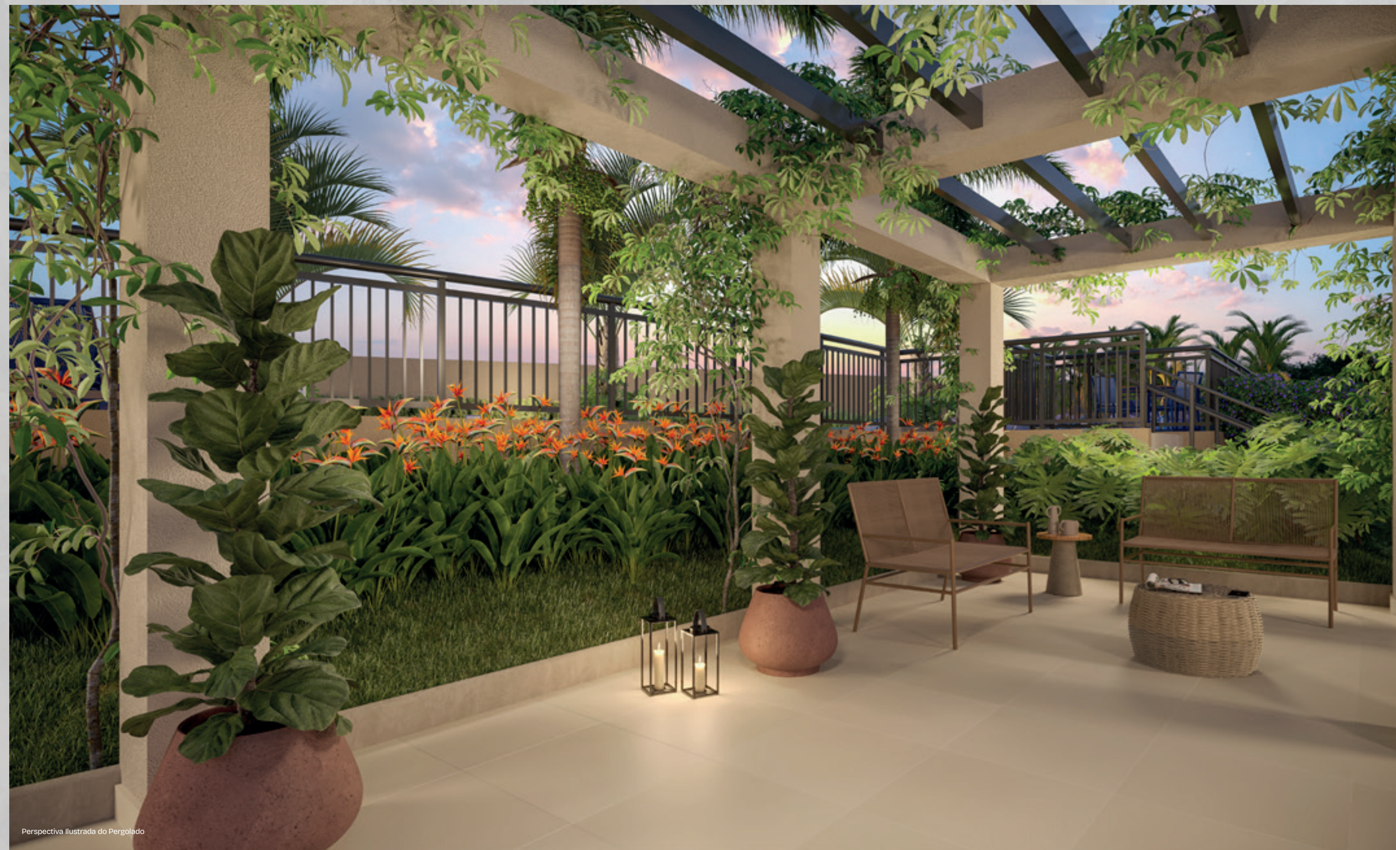
Perspectiva Ilustrada do Pergolado