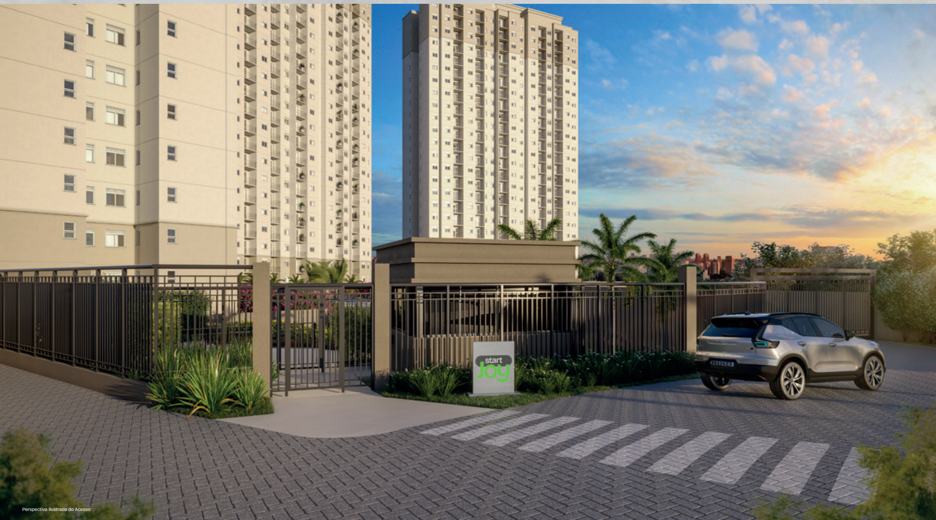
Perspectiva Ilustrada do Acesso