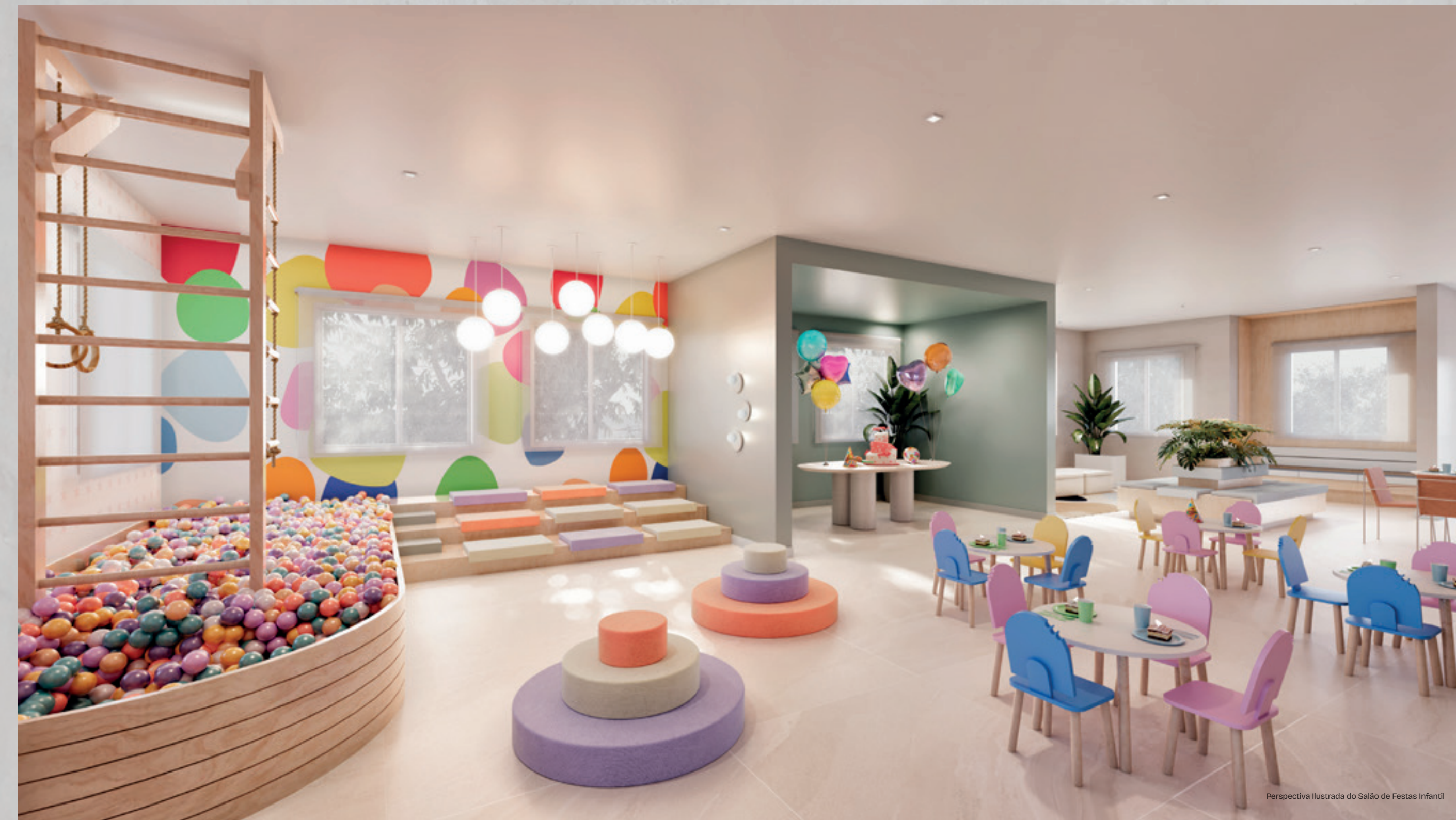
Perspectiva Ilustrada do Salão de Festas Infantil