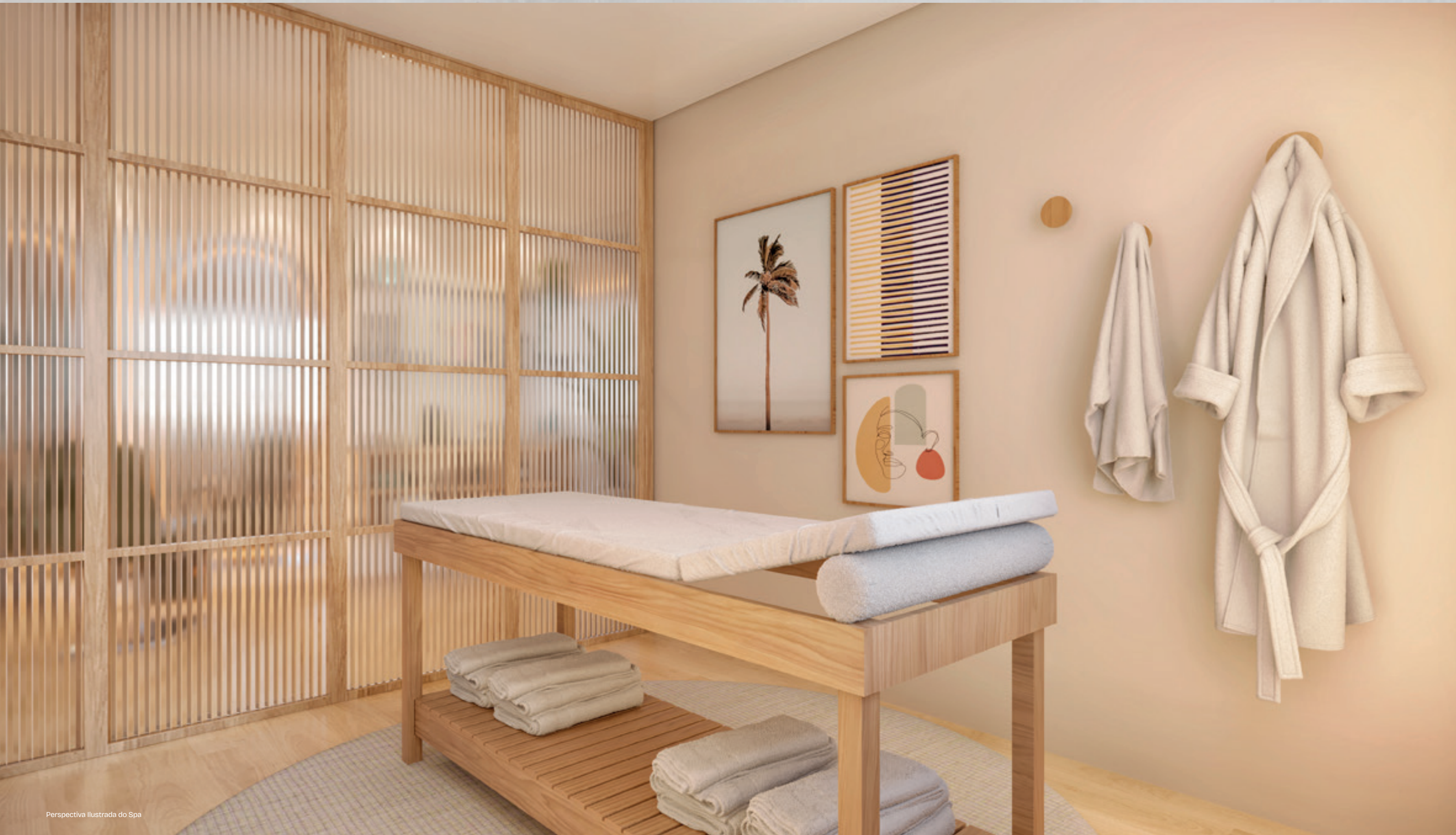
Perspectiva Ilustrada do Spa