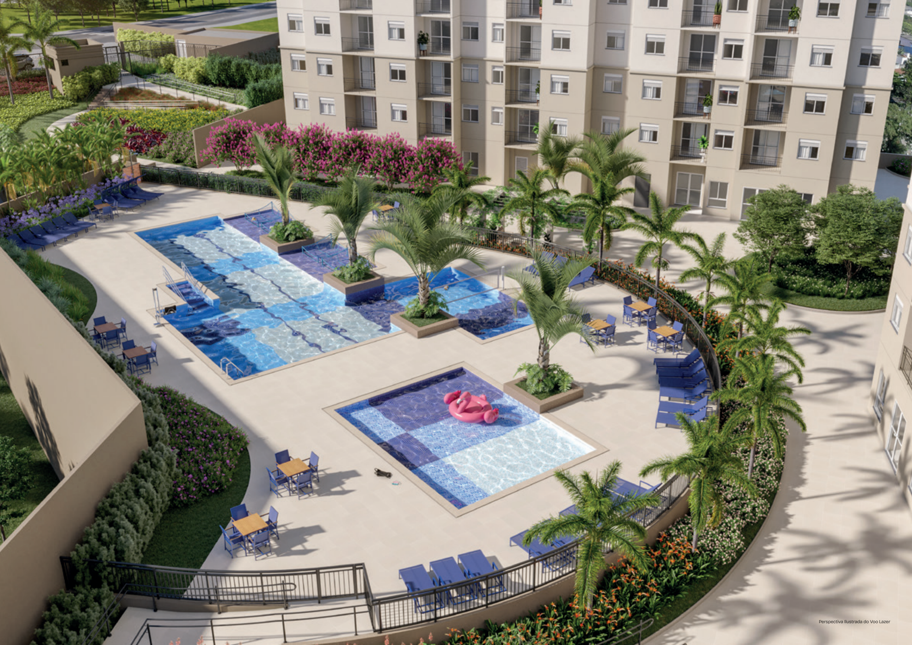
Perspectiva Ilustrada do Voo Lazer