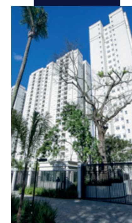
Start São Bernardo do Campo - SP