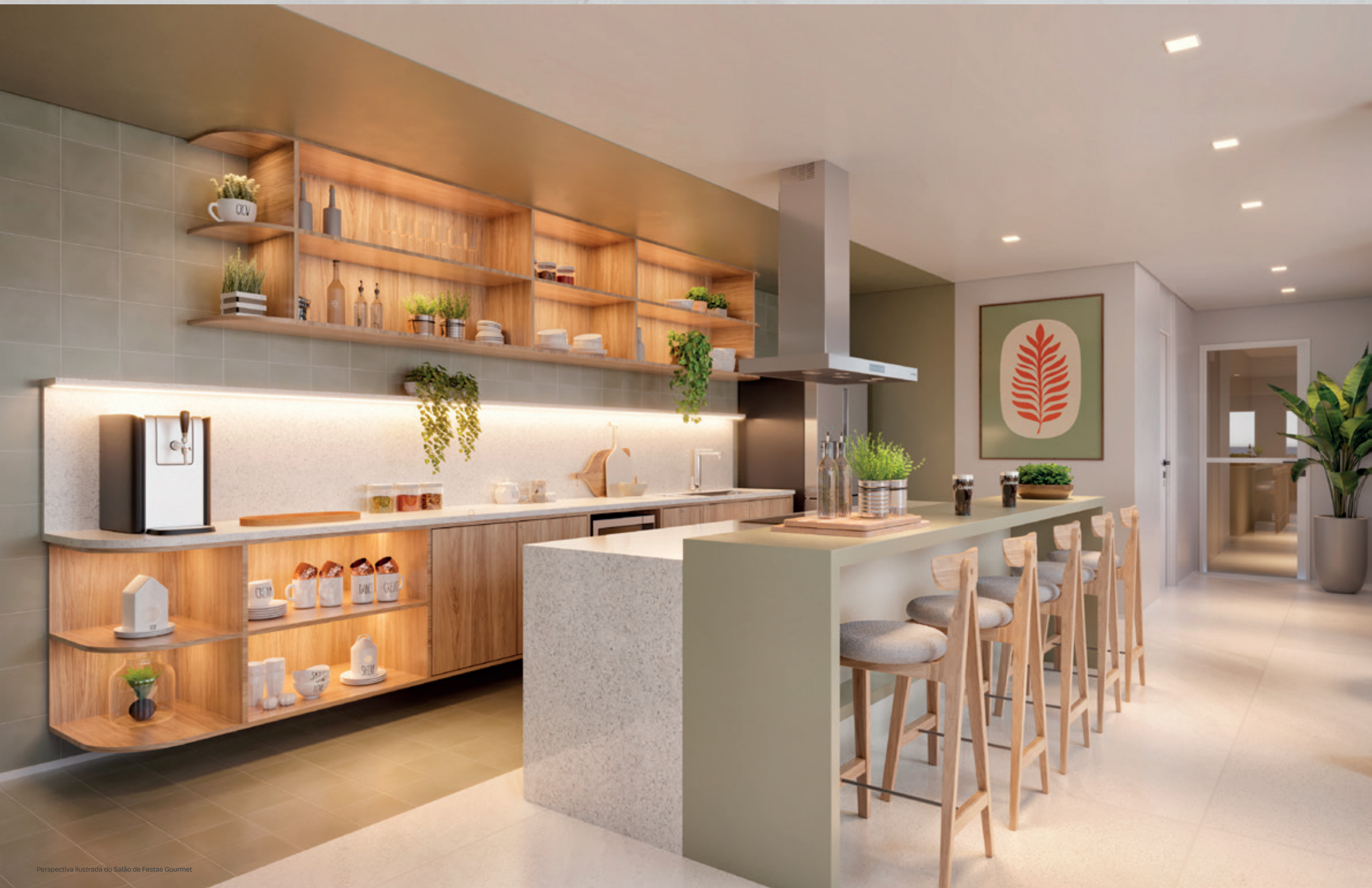
Perspectiva Ilustrada do Salão de Festas Gourmet