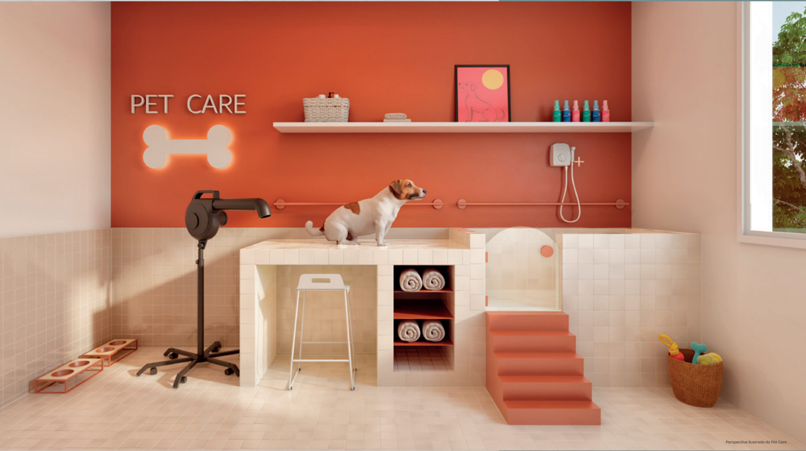
Perspectiva Ilustrada do Pet Care