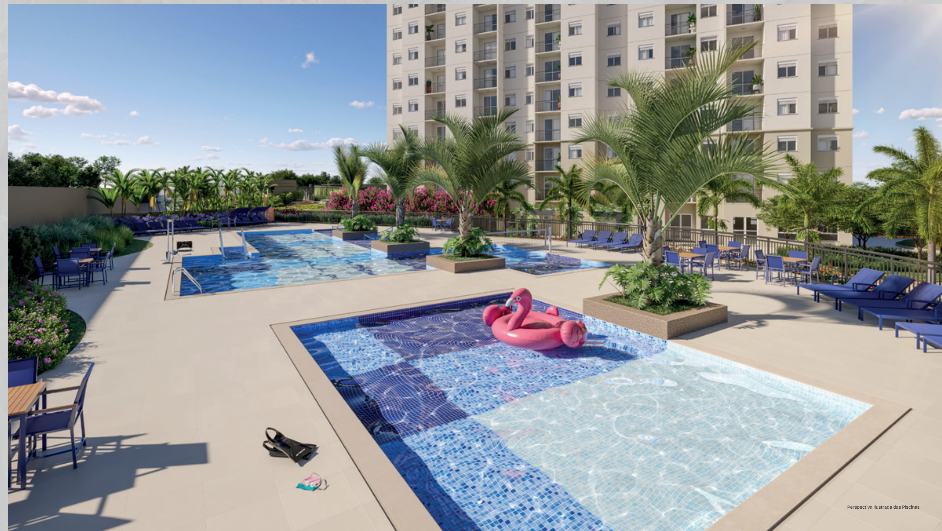
Perspectiva Ilustrada das Piscinas