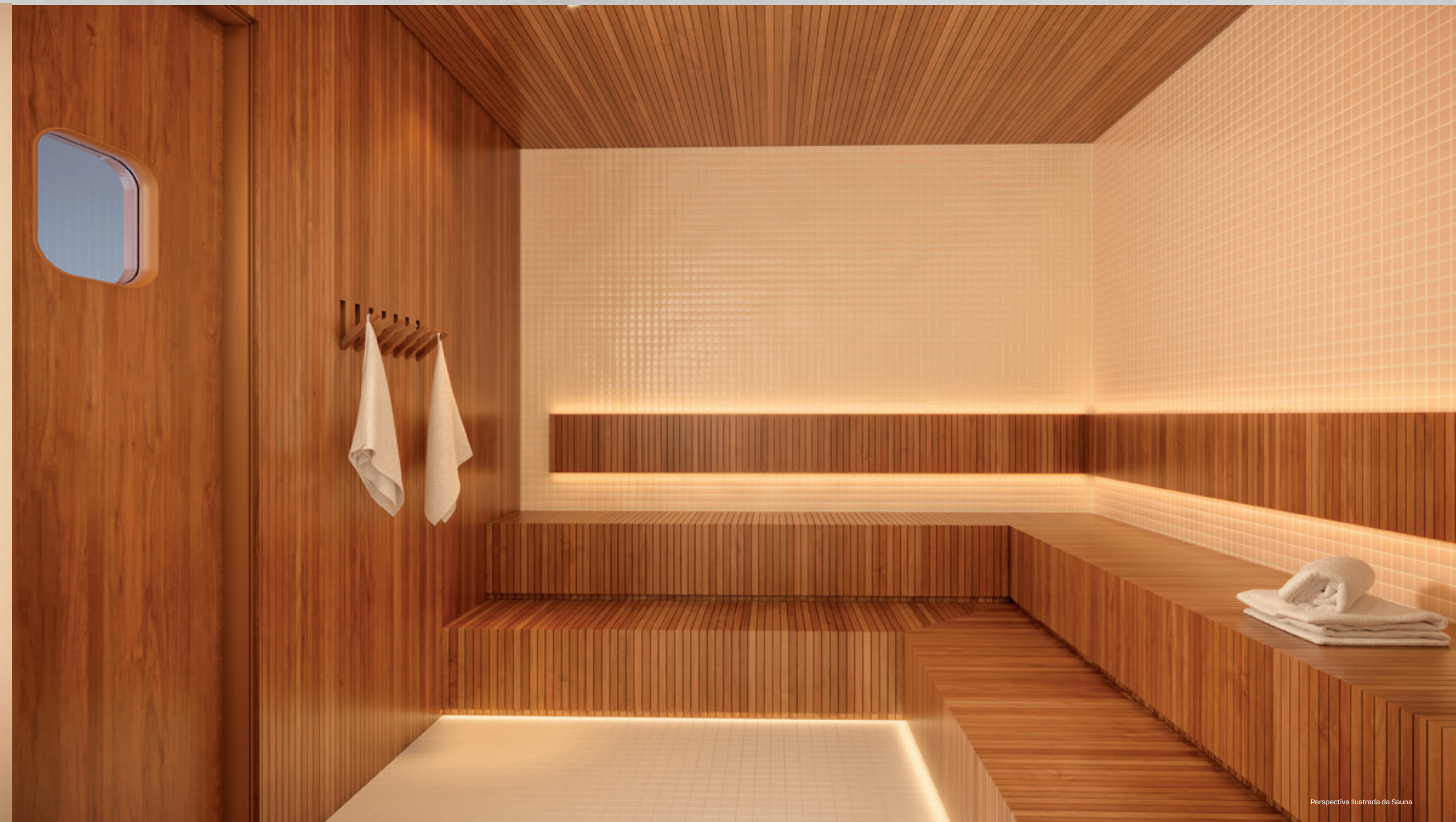
Perspectiva Ilustrada da Sauna