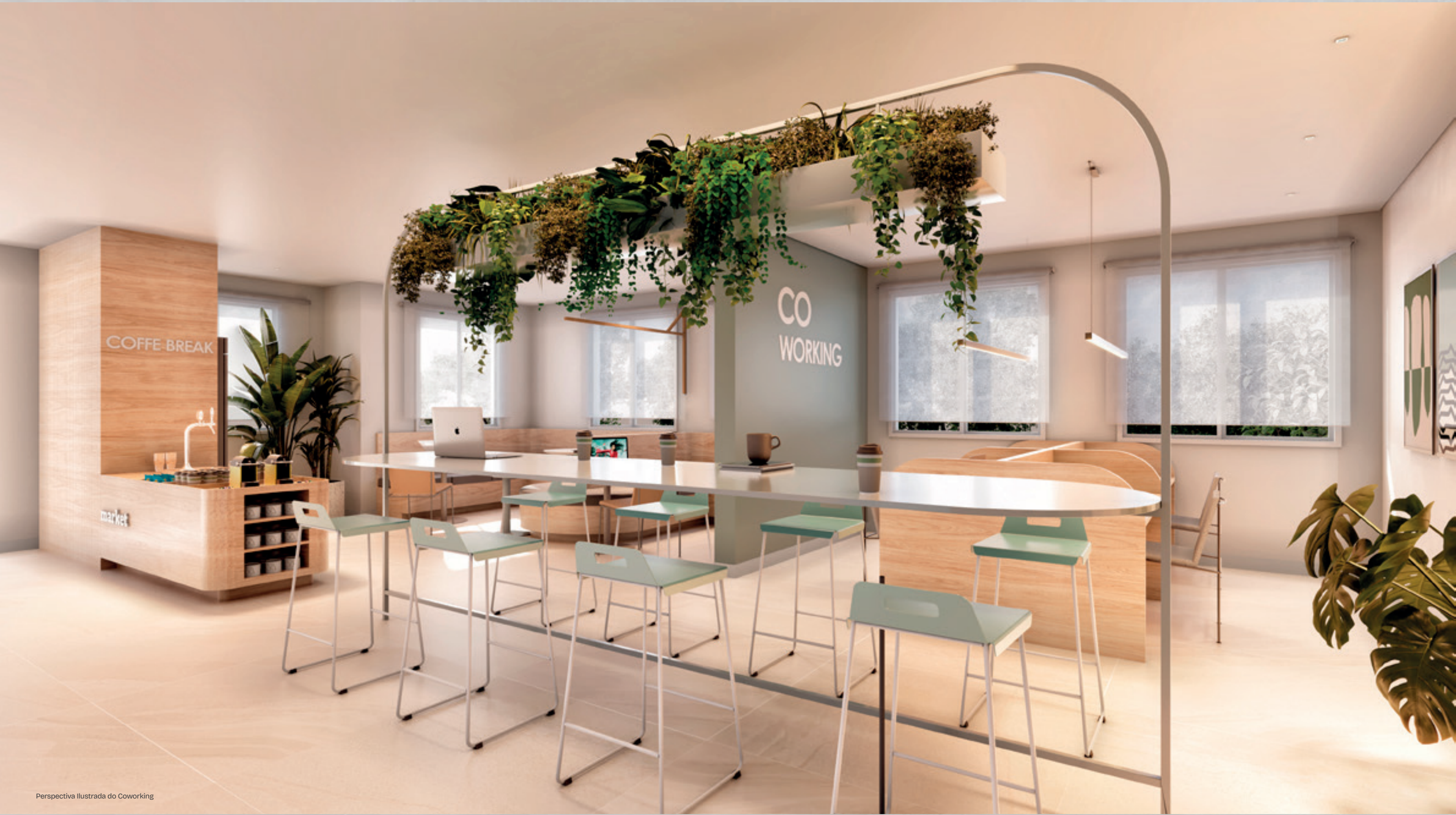
Perspectiva Ilustrada do Coworking