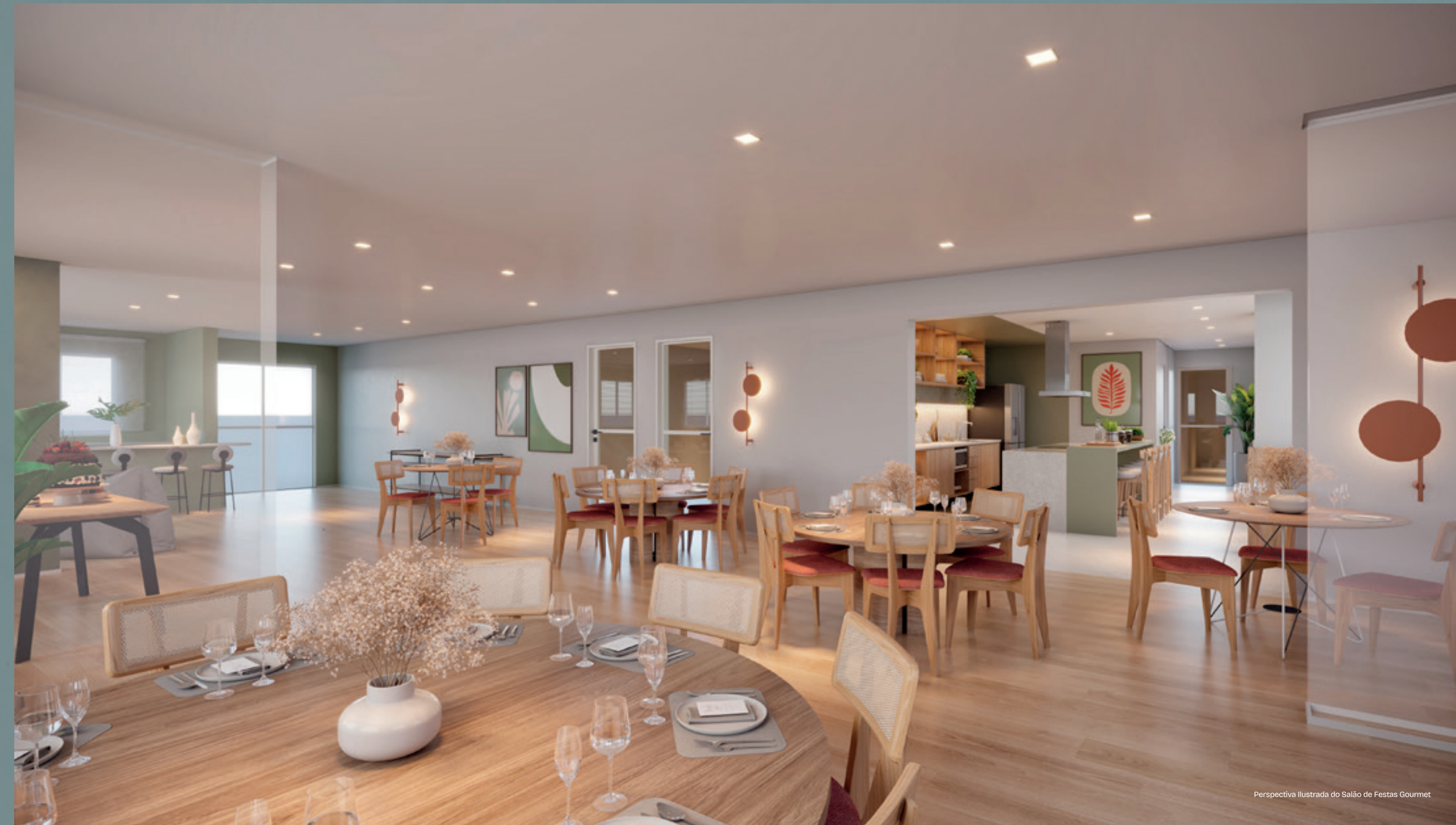
Perspectiva Ilustrada do Salão de Festas Gourmet