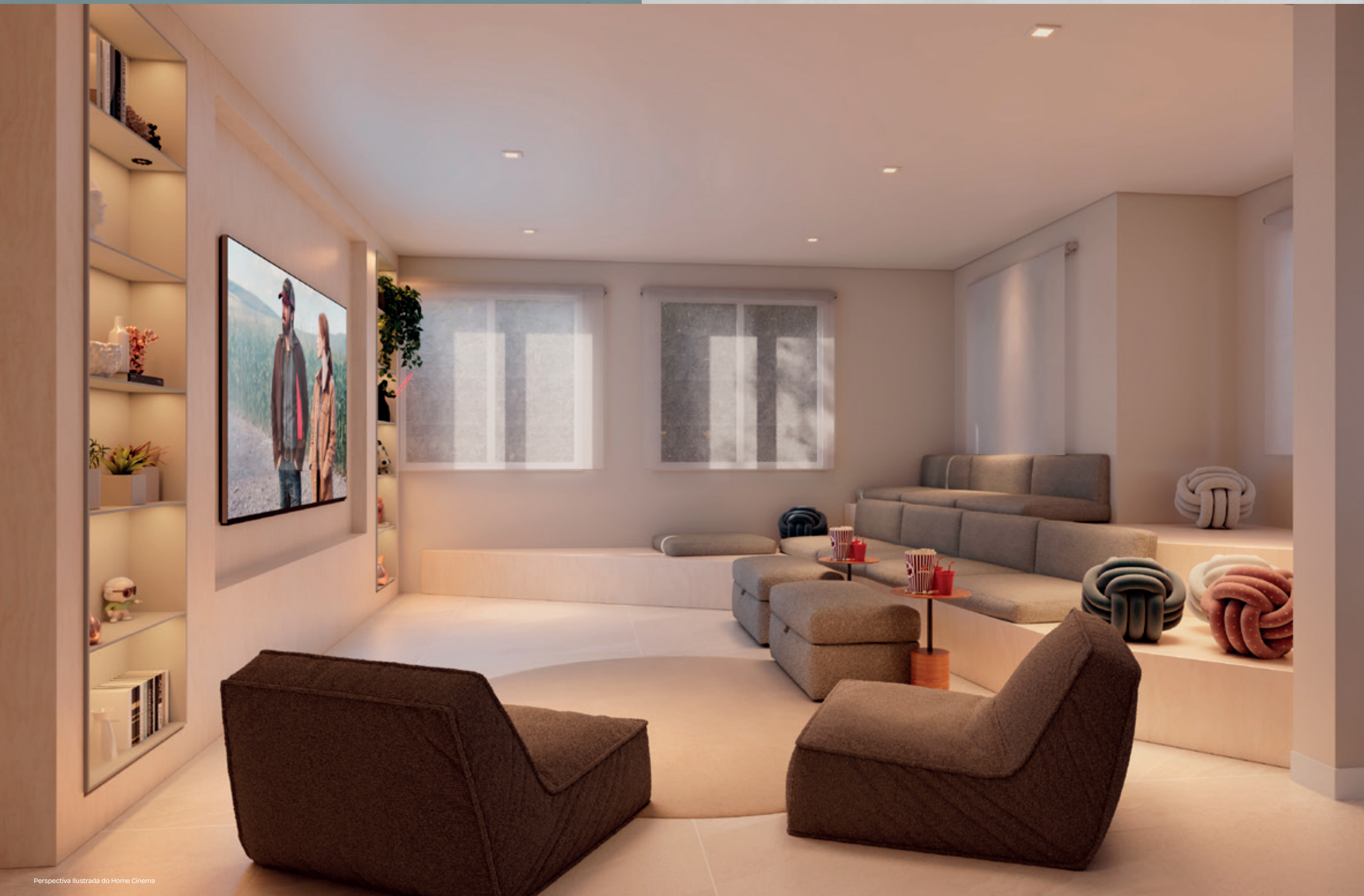
Perspectiva Ilustrada do Home Cinema