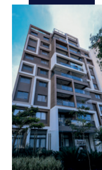
Brand Pensilvânia São Paulo - SP