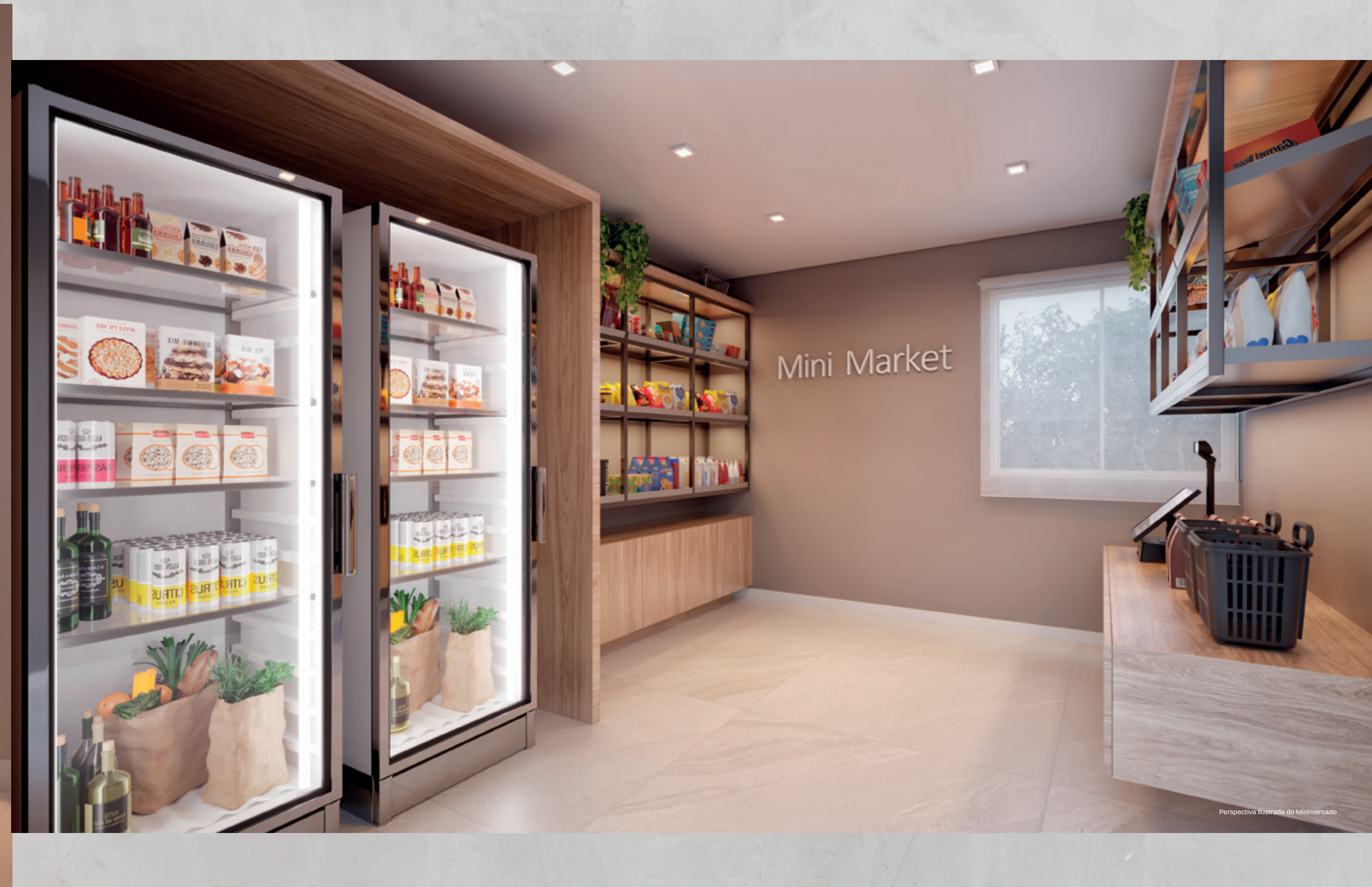
Perspectiva Ilustrada do Minimercado