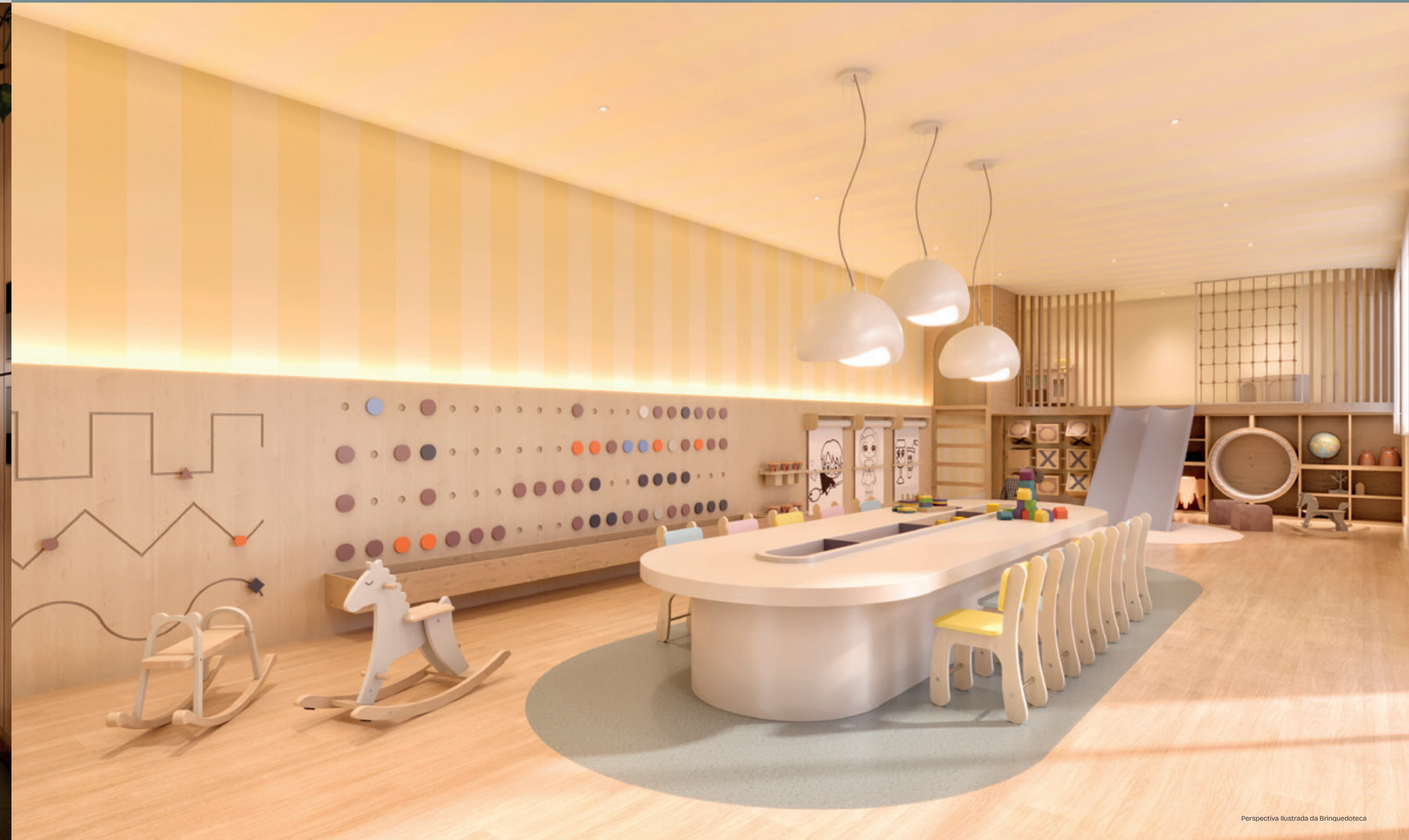
Perspectiva Ilustrada da Brinquedoteca