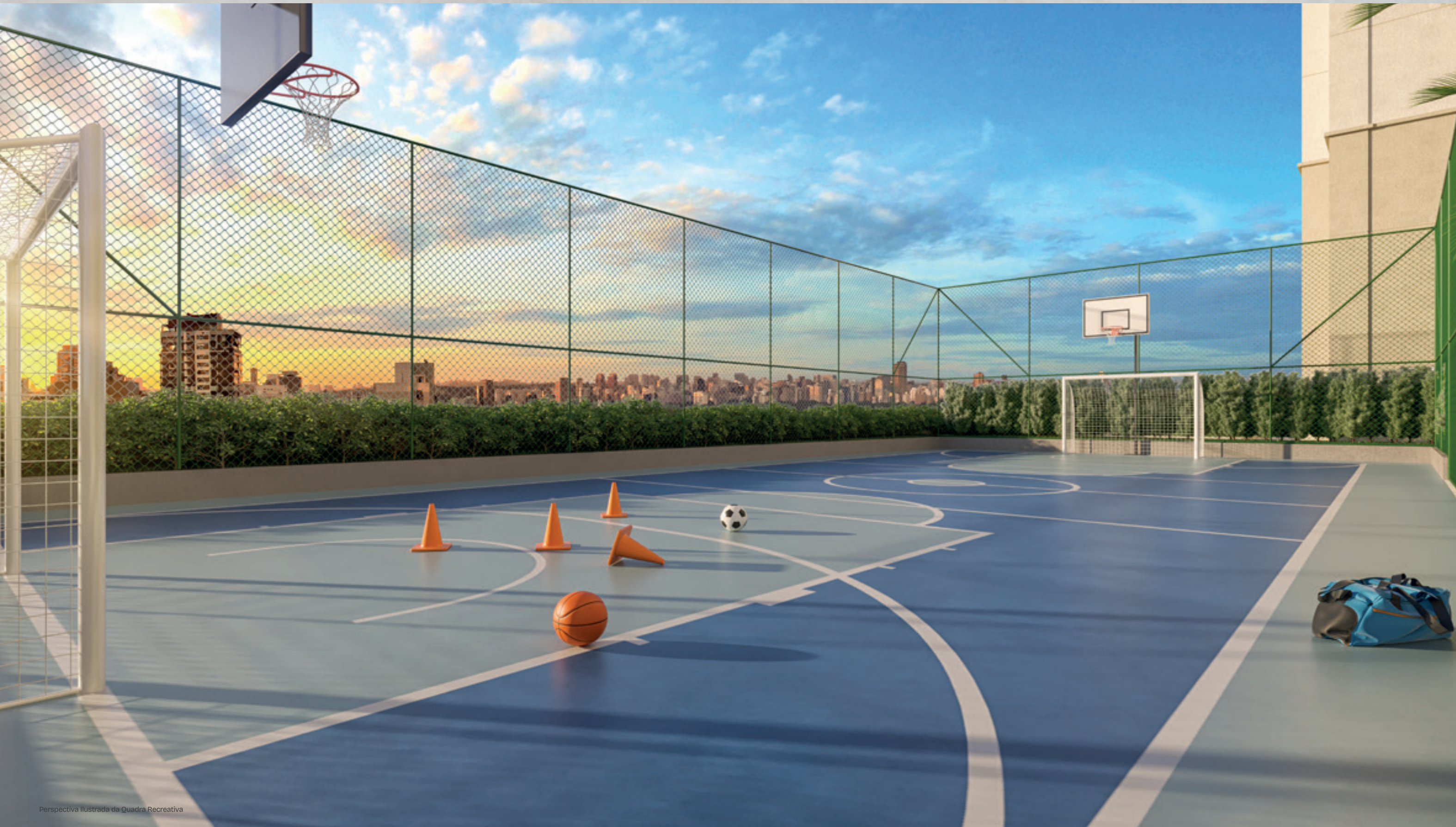
Perspectiva Ilustrada da Quadra Recreativa