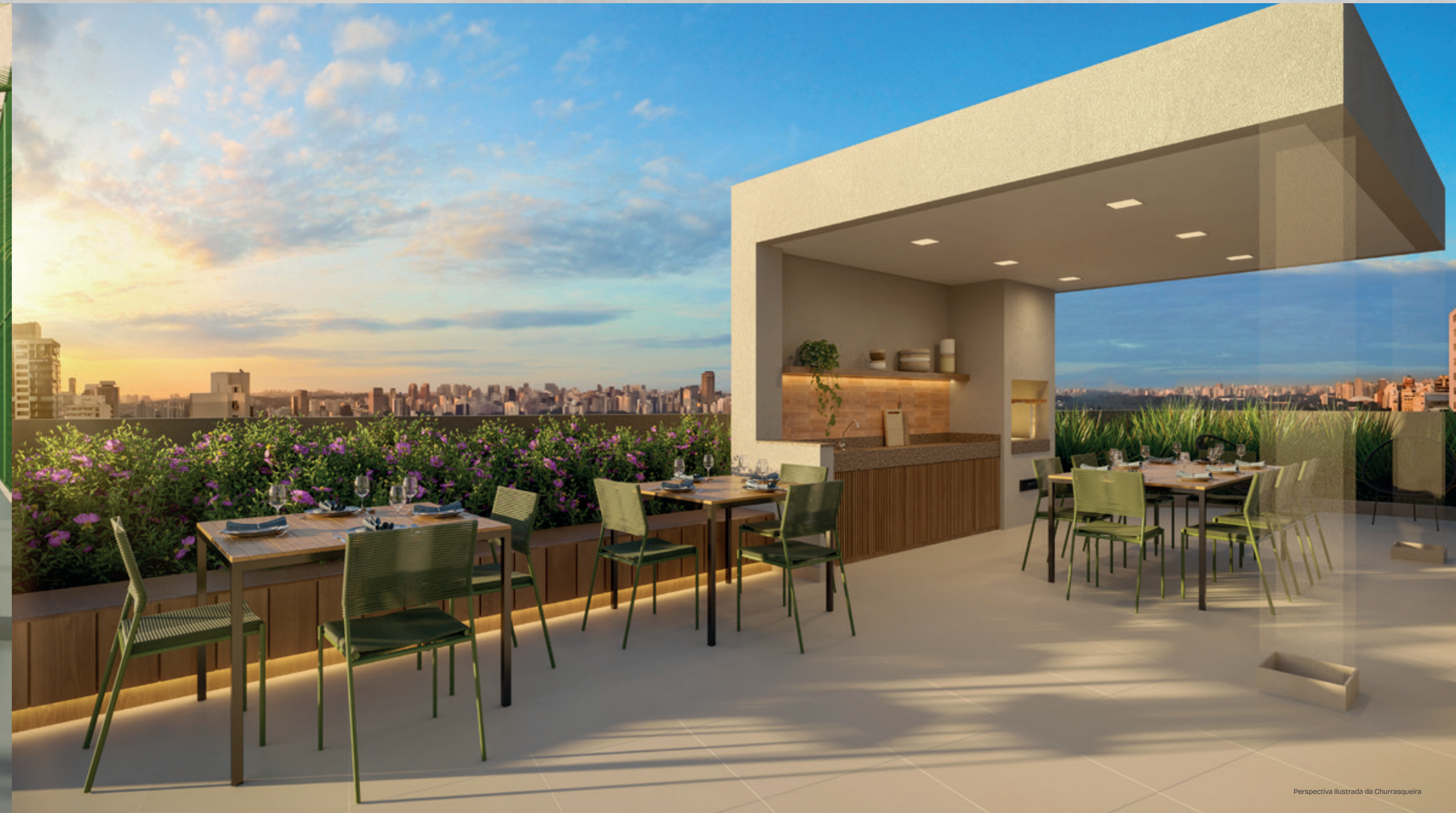
Perspectiva Ilustrada da Churrascqueira