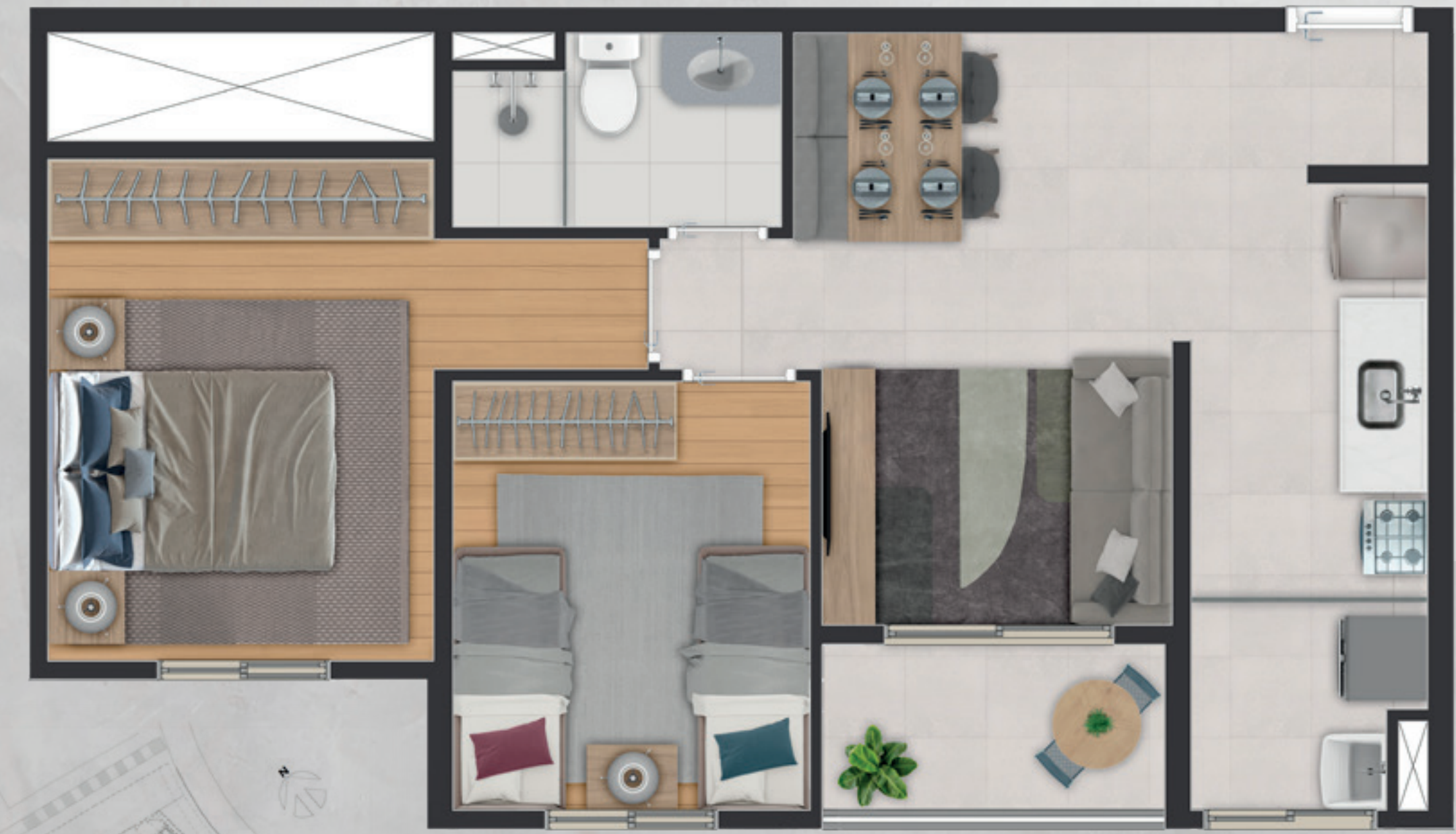
PLANTA ILUSTRADA (sem escala E) do apartamento de 51,52m² final 05, com sugestão de decoração. As medidas são internas e de face a face das paredes. Os móveis e utensílios são de dimensões comerciais e não fazem parte do contrato. Os acabamentos serão entregues conforme Memorial Descritivo integrante do Contrato de Compra e Venda.