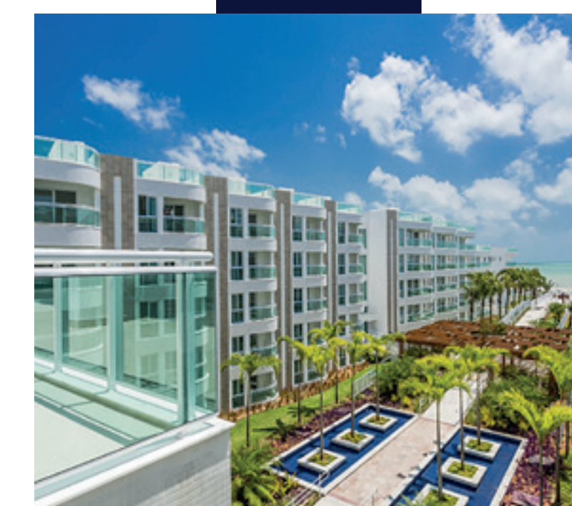
In Mare Bali Praia do Cotovelo - RN