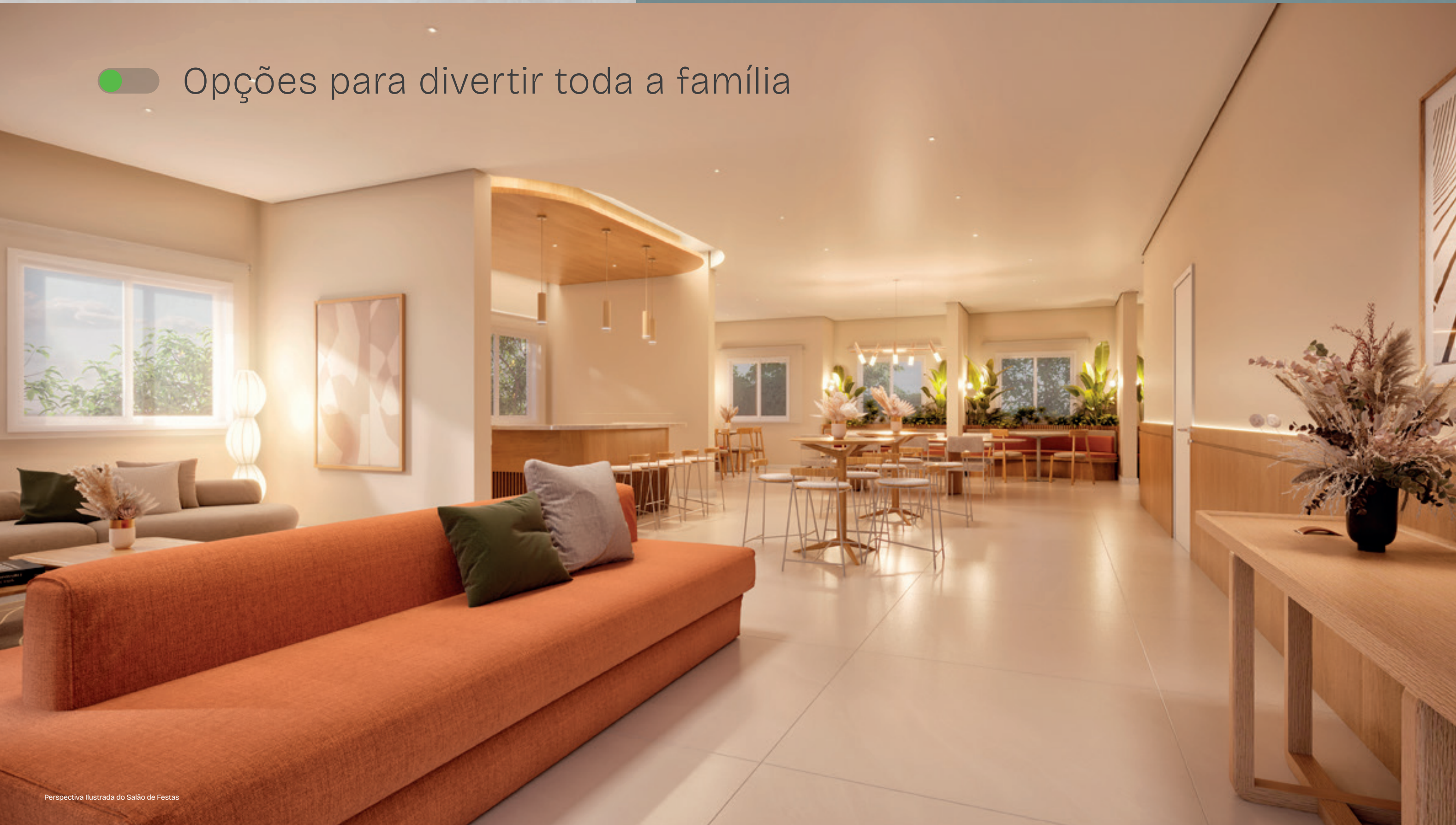
Perspectiva Ilustrada do Salão de Festas