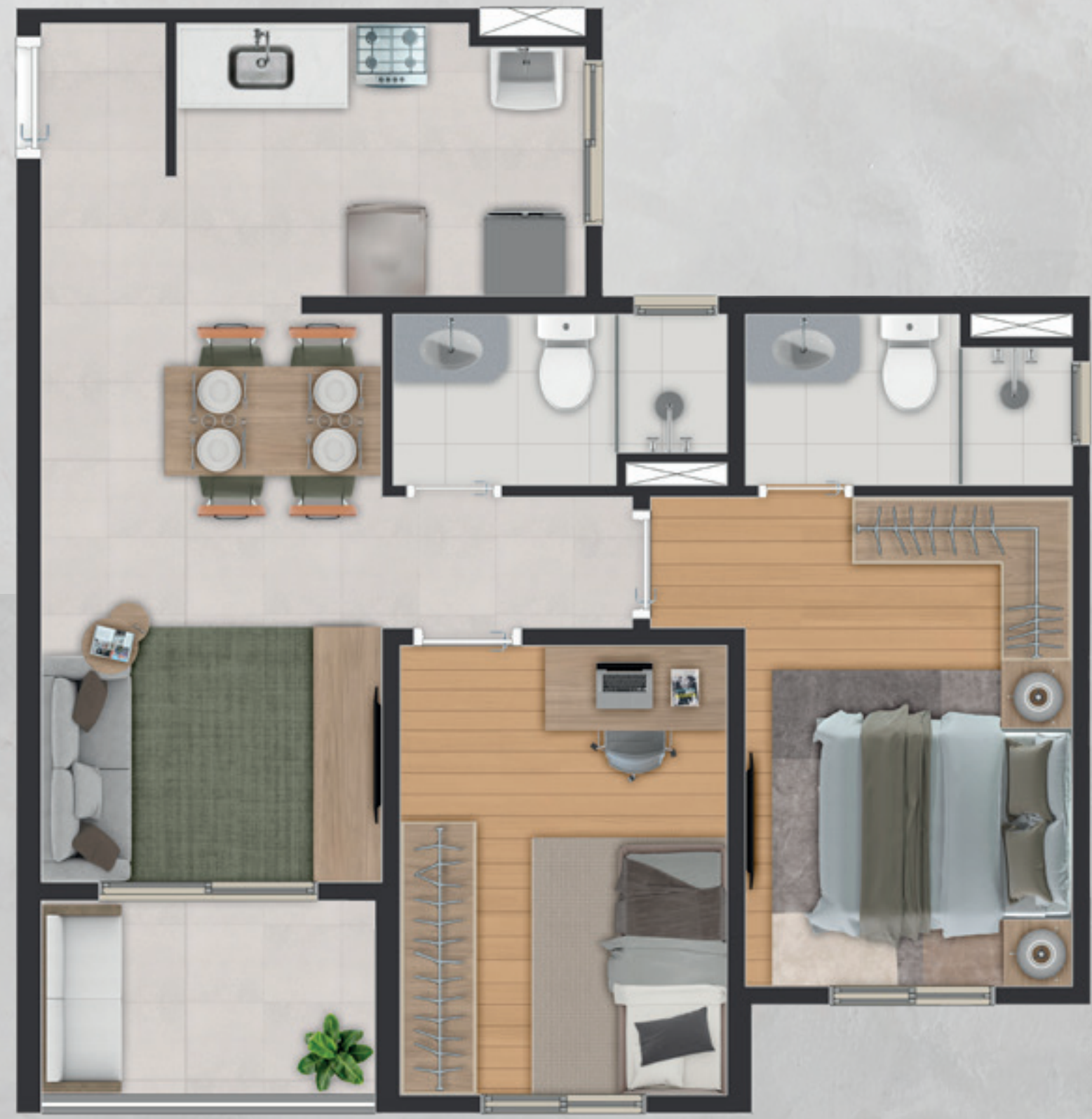
PLANTA ILUSTRADA (sem escala E) do apartamento de 54,07m² final 03, com sugestão de decoração. As medidas são internas e de face a face das paredes. Os móveis e utensílios são de dimensões comerciais e não fazem parte do contrato. Os acabamentos serão entregues conforme Memorial Descritivo integrante do Contrato de Compra e Venda.